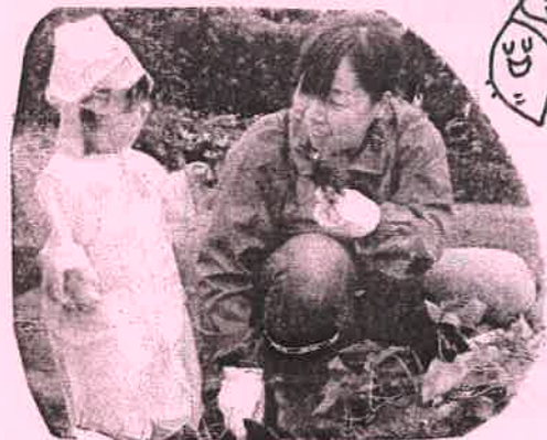
見て! おいも掘りたよ