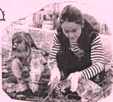
いっしょママも... よいしょ!!